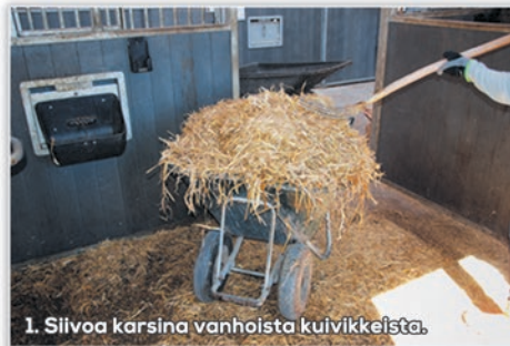
1. Siivoa karsina vanhoista kuivikkeista.