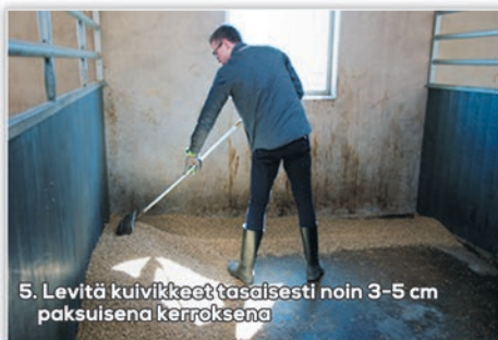
5. Levitä kuivikkeet tasaisesti noin 3-5 cm paksuisena kerroksena