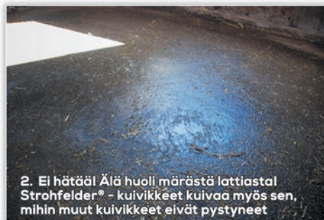
2. Ei hätää! Älä huoli märästä lattiasta! Strohfelder® - kuivikkeet kuivaa myös sen, mihin muut kuivikkeet eivät pystyneet