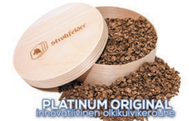
PLATINUM ORIGINAL Innovatiivinen oikkuivikeruuhe