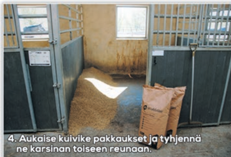
4. Aukaise kuivike pakkaukset ja tyhjennä ne karsinan toiseen reunaan.