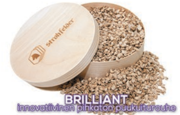
BRILLIANT Innovatiivinen pinkaton puukuituruuhe

Strohfelder® tuotteiden tasainen korkea laatu ja puhtaus on taattu Itävaltalaisella tarkkuudella, jatkuvalla tuotekehityksellä ja kuivikealan tuntemisella.