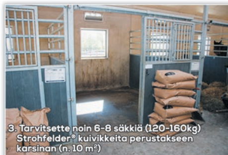
3. Tarvitsette noin 6-8 säkkiä (120-160kg) Strohfelder® kuivikkeita perustakseen karsinan (n. 10 m 2 )